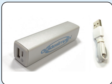
Batteria supplementare per la ricarica della batteria interna del trasmettitore